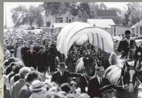
Streuvels' begrafenis in 1969.

de Nederlandse middelbare scholen? Eerst leerde ik over hem, en nadien ontmoette ik hem persoonlijk. Dat was heel indrukwekkend voor een jong meisje als ik.